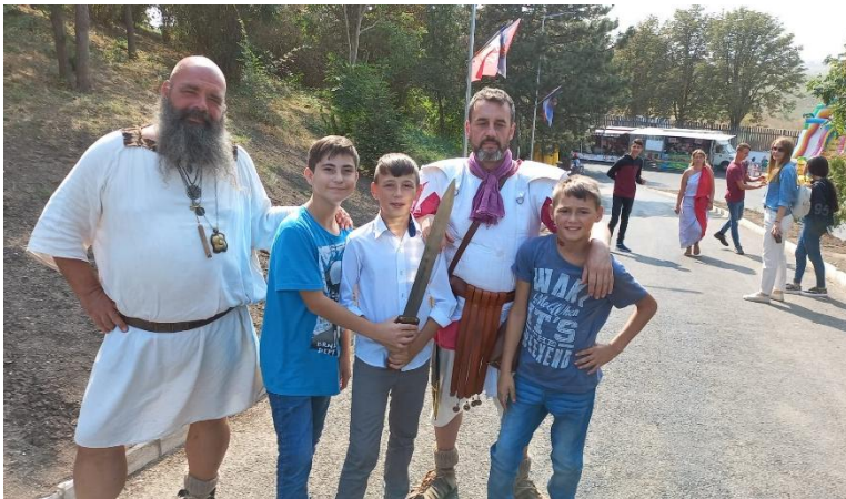
(↑) Eveniment istoric în Medgidia, la care băieții noștri au luat parte în Septembrie