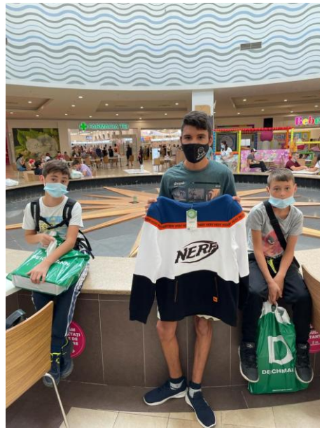
(↑) Sesiune de cumpărături pentru băieții noștri 😊